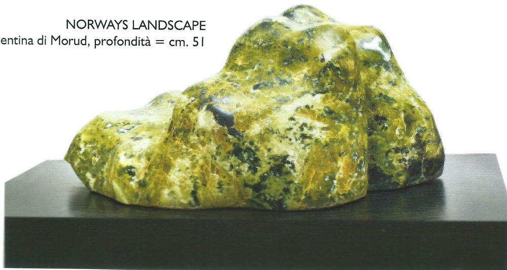
NORWAYS LANDSCAPE serpentina di Morud, profondità = cm. 51